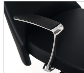
Металлические подлокотники с пластиковыми накладками