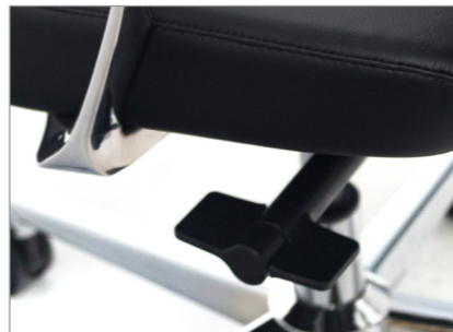
Регулировка сиденья по высоте (расположена справа от сидящего)